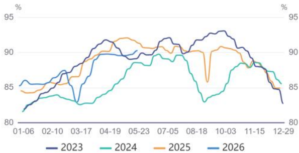
产能利用率:全国(样本数247家):当周值